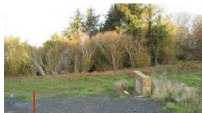
Pencran Finistère 29 8 terrains