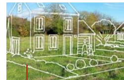
Saint-Georges-du-Bois Sarthe 72 11 terrains