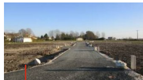
Semussac Charente-Maritime 17 3 terrains